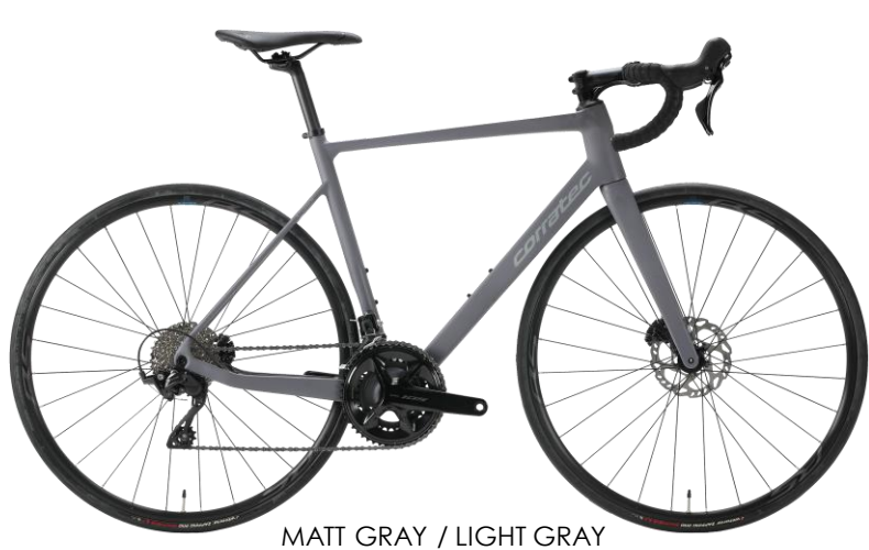
MATT GRAY / LIGHT GRAY