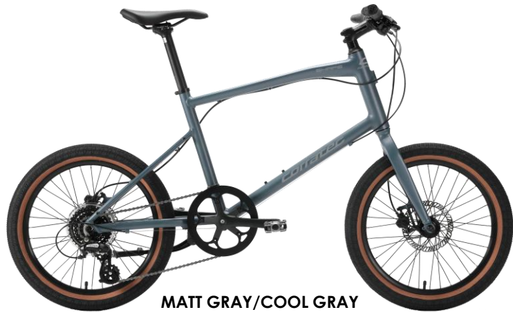
MATT GRAY/COOL GRAY