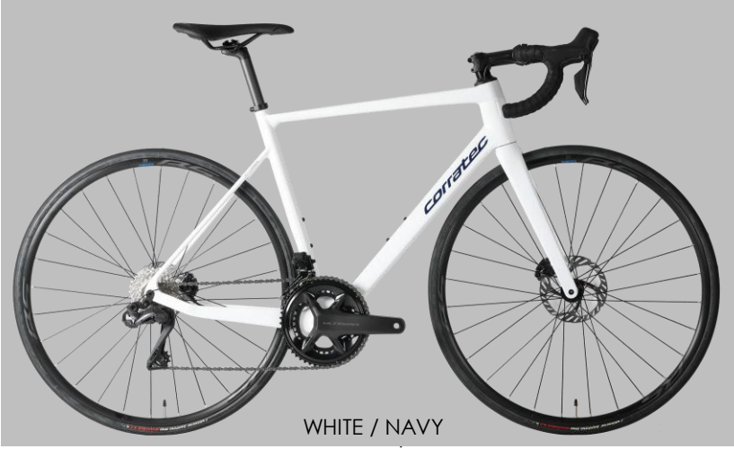
WHITE / NAVY